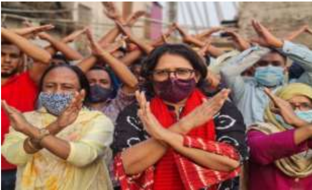
“ബ്രേക്ക് ദ ബയാസ്” എന്ന ആപ്തവാക്യത്തിന്റെ കൈമുദ്ര.

ഒരു ലിംഗ സമത്വ ലോകം സങ്കല്പിക്കുക. പക്ഷപാതവും സർവ്വസാധാരണമായ സ്ഥിരസങ്കല്പനവും (സ്റ്റീരിയോ ടൈപ്പുകളും) വിവേചനവും ഇല്ലാത്ത ഒരു ലോകം.. വൈവിധ്യവും സമത്വവും ഉൾക്കൊള്ളുന്നതുമായ ഒരു ലോകം. വ്യത്യസ്തതയെ വിലമതിക്കുകയും ആഘോഷിക്കുകയും ചെയ്യുന്ന ലോകം.. നമുക്ക് ഒരുമിച്ച് സ്ത്രീ സമത്വം രൂപപ്പെടുത്താം. നമുക്കെല്ലാവർക്കും കൂട്ടായി പക്ഷപാതം തകർക്കാൻ കഴിയും.