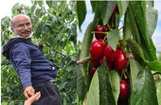
ചെറി പഴങ്ങൾ പഠിച്ചെടുക്കുന്ന ലേഖകൻ

പിന്നീട് യാത്ര പോയത് ഒരു പക്ഷേ നമ്മുടെ നാട്ടിലും ഉണ്ടോ എന്നു സംശയിച്ചു പോകുന്ന ഒരു സ്ഥലത്തേയ്ക്കാണ്. നവംബർ/ഡിസംബർ മാസങ്ങളിൽ കുടുംബ സമേതം കുട്ടികളുമായി വിനോദ സഞ്ചാരത്തിനു തിരഞ്ഞെടുക്കുന്ന ബാർക്കസ് മാഷിലേയ്ക്കായിരുന്നു ആ യാത്ര. നമ്മുടെ പുരയിടത്തിൽ നിന്നും എന്ന പോലെ, നമ്മുക്കു തന്നെ പഴുത്തു പാകമായി നിലക്കുന്ന ആപ്പിളും, സ്ത്രോബറിയും, ചെറിയും, നെക്ടറിനും, പ്ളമും എല്ലാം പഠിച്ചെടുക്കാം. (അതാതു സീ സണിൽ മാത്രം). ഇപ്പോൾ ചെറിയുടേയും, സ്ത്രോബറിയുടേയും കാലം. എന്ദ്രി പാസ് ഓൺലൈനായി ബുക്കു ചെയ്തിരുന്നു. ഉള്ളിലേക്കു കടക്കുമ്പോൾ പഴങ്ങൾ ശേഖരിക്കുന്നതിനുള്ള പ്ലാസ്റ്റിക് ബോക്സുകൾ കൗണ്ടറിൽ നിന്നും നൽകി. പാർക്കിംഗ് ഏരിയയിൽ അമ്പതിലേറെ കാറുകൾ ഉണ്ടായിരുന്നു. ഫാമിലിയേയ്ക്കു കടന്നപ്പോൾ കുഞ്ഞുകുട്ടികൾ മുതൽ അപ്പനപ്പൂപ്പൻമാർ വരെ ആസ്വദിച്ച് സ്ത്രോബറി ശേഖരിക്കുന്നു. നല്ല ആൾക്കൂട്ടം . അതുകൊണ്ട് ഞങ്ങൾ ആദ്യം ചെറി ശേഖരിക്കുവാൻ നീങ്ങി.