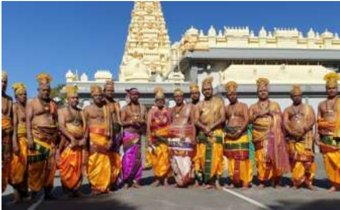
ഉത്സവ വേളകളിൽ പൂജാരിമാർ

ശിവവിഷ്ണു ക്ഷേത്രം. ദർശനത്തിന് ഒരു മണിക്കൂറിൽ കൂടുതലേടുത്തു. ക്ഷേത്രത്തിൽ പ്രവേശനത്തിന് ഏതു വേഷം എന്ന നിയന്ത്രണങ്ങളൊന്നും ഇല്ല. പൂജാരിമാർ പൊതുവെ കന്നഡ, തെലുങ്കു പൂജാരിമാരെപ്പോലെ ആണ്.