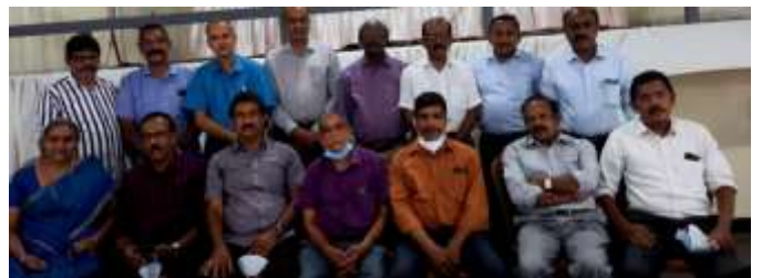
ആലപ്പുഴ ജില്ലാ കമ്മിറ്റി പുതിയ ഭാരവാഹികൾ

2022-2025 ത്രിവത്സര കാലയളവിലേക്ക് ആലപ്പുഴ ജില്ലാ കമ്മിറ്റിയിൽ താഴെപ്പറയുന്ന അംഗങ്ങളെ തിരഞ്ഞെടുത്തു.