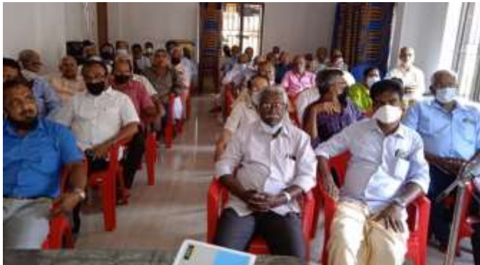
മലപ്പുറം ജില്ലാ സമ്മേളനത്തിൽ പങ്കെടുത്തവർ