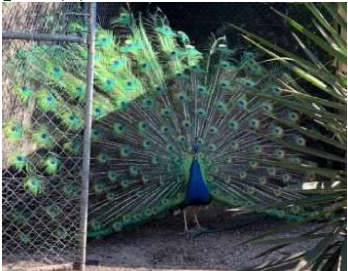
ക്ഷേത്ര കവാടത്തിനരികെ നൃത്തമാടുന്ന മയിൽ.

ഇടയ്ക്കിടയ്ക്ക് കോവിഡ് റിപ്പോർട്ട് ചെയ്യുകയും അപ്പോൾ ലോക്ക് ഡൗണും, പിന്നീട് പിൻവലിക്കലും, അത് ജീവിതത്തിന്റെ ഭാഗമായി മാറി. സാധനങ്ങൾ വാങ്ങുന്നത് ഹോം ഡെലിവറി വഴി തന്നെ തുടർന്നു. വിക്ടോറിയ സംസ്ഥാനം കോവിഡ് വ്യാപനം കുറഞ്ഞ സംസ്ഥാനമായി തുടർന്നു. ലോക്ക് ഡൗൺ ഇല്ലാതിരുന്ന ഒരു ആഴ്ചയിൽ ടെ കി.മീ. അകലെയുള്ള കാരം ഡൗണിലുള്ള വിഷ്ണു ശിവ ക്ഷേത്ര സന്നിധിയിലേക്ക് ആയിരുന്നു യാത്ര. ചെന്നിറങ്ങാൻ സമയം നല്ല കനത്ത മഴയും കാറ്റും. താമസിയാതെ തന്നെ മഴ നിലച്ചു. കാർ പാർക്കിങ്ങിനു സമീപമുള്ള കൂട്ടിൽ കുഞ്ഞുങ്ങൾക്ക് ഇഷ്ടപ്പെടുന്ന മയിലുകളും , മൂയലുകളും ഉണ്ടായിരുന്നു.