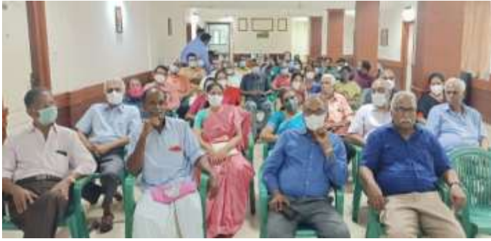
പൊതുയോഗത്തിൽ പങ്കെടുക്കുന്ന സദസ്സ്

മനസ്സിൽ ചെറുപ്പം കാത്തുസൂക്ഷിക്കുവാനും ജീവിതം ആഹ്ലാദകരമായി മുന്നോട്ടു കൊണ്ടുപോകുവാനും നമ്മൾ പരിശ്രമിക്കണമെന്ന് ഉദ്ബോധിപ്പിച്ചു കൊണ്ട് പൊതുയോഗം ഔപചാരികമായി ഉൽഘാടനം ചെയ്യു്തു.