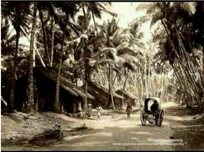
കൊല്ലം തിരുവനന്തപുരം ദേശീയപാത 1891ലെ ചിത്രം