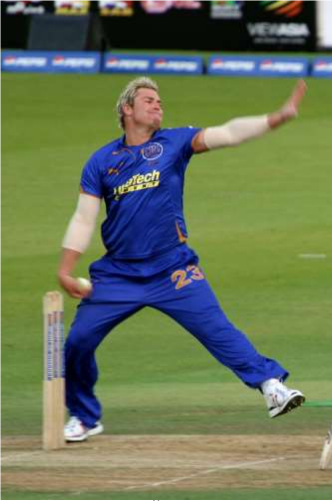
2009ൽ ലോർഡ്സിൽ രാജസ്ഥാൻ റോയൽസിനെതിരെ വോൺ

വോൺ അന്താരാഷ്ട്ര ക്രിക്കറ്റിൽ, ടെസ്റ്റിലും, ഏകദിനത്തിലും കൂടി, ആകെ 1000-ൽ അധികം റിക്കറ്റുകൾ നേടിയിട്ടുണ്ട്. മുത്തയ്യ മുരളീധരനു ശേഷം ഈ നേട്ടം കൈവരിക്കുന്ന ക്രിക്കറ്ററായിരുന്നു വോൺ. ടിവി പ്രക്ഷേപണം തുടങ്ങുന്നതിന് മുൻപ് തന്നെ ഇന്ത്യൻ മനസ്സുകളെ ആകർഷിക്കുകയും ഐക്കണിക്ക് പദവി നേടുകയും ചെയ്തിരുന്നു.