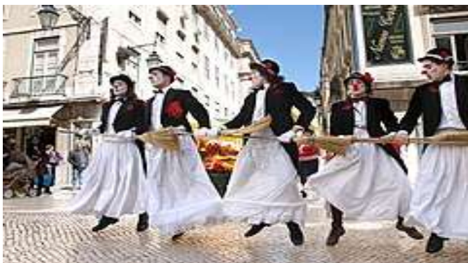
ലോക നാടക ദിനത്തിലെ ഒരു പ്രകടനം

ഇന്റർനാഷണൽ തിയറ്റർ ഇൻസ്റ്റിറ്റ്യൂട്ടാണ് (ഐടിഐ) 1962 ൽ ലോക നാടക ദിനം ആരംഭിച്ചത്. എല്ലാ വർഷവും മാർച്ച് 27 ന് ഐടിഐ സെന്ററുകളും അന്താരാഷ്ട്ര നാടക സമൂഹവും ഇത് ആഘോഷിക്കുന്നു. ഈ അവസരത്തോടനുബന്ധിച്ച് വിവിധ ദേശീയ അന്തർദേശീയ നാടക പരിപാടികൾ സംഘടിപ്പിക്കുന്നു. ഐടിഐയുടെ ക്ഷണപ്രകാരം ലോകനിലവാരമുള്ള ഒരു വ്യക്തി “ തിയേറ്ററും സമാധാനത്തിന്റെ സംസ്കാരവും ” എന്ന വിഷയത്തിൽ തന്റെ ആശയങ്ങൾ പങ്കുവെക്കുന്നു.