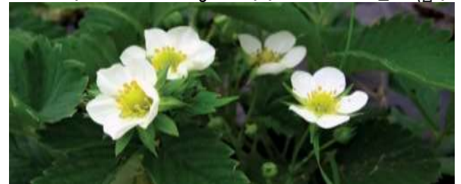
പൂത്തു നിലക്കുന്ന സ്ത്രോബെറി ചെടി

ലോകമെമ്പാടും കൃഷി ചെയ്യപ്പെടുന്ന ഒരിനം സ്ത്രോബെറിയാണ് ഗാർഡൻ സ്ത്രോബെറി. ഫ്രഗേറിയ ജനുസിലെ (സ്ത്രോബെറി) മറ്റ് സ്പീഷിസുകളേപ്പോലെ ഗാർഡൻ സ്ത്രോബെറിയും റോസേഷ്യ കുടുംബത്തിൽ ഉൾപ്പെടുന്നു.